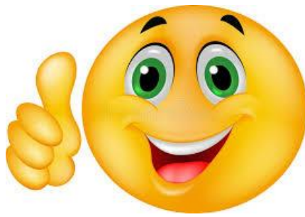
Fotografía 1: La felicidad

7. Inserte una tabla 8x8 y haga la siguiente figura